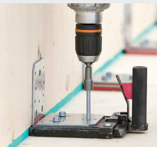
Elastischer Winkelverbinder ABAI 105

B este Wohnqualität setzt einen wirkungsvollen Schutz vor Luft- und Trittschall voraus. Neben dem Schallschutz gegen Lärm von außen ist dieser auch ein Thema im Gebäudeinneren. Um die Schallübertragung auf ein Minimum zu reduzieren, kontaktierte das Bauunternehmen Getzner als Spezialisten für Schwingungsschutz. Das Ergebnis: eine herausragende Lösung zur Schalldämmung.