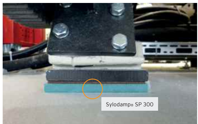
Webmaschinenfuß mit zusätzlicher Sylodamp® Lagerung