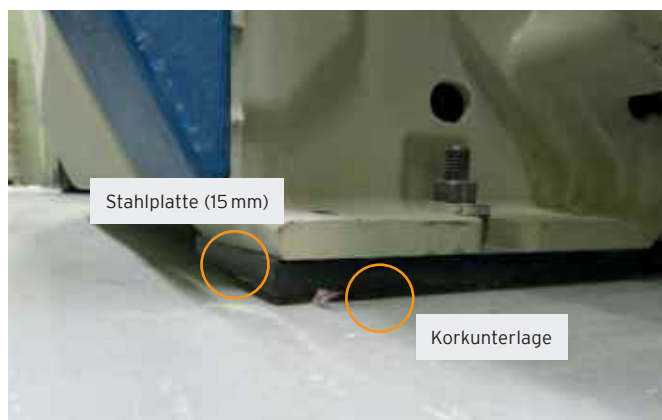
Webmaschinenfuß mit Standard-Korkunterlage