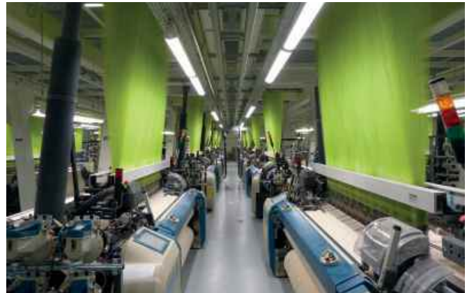
Produktionshalle mit Webmaschinen

In zwei Produktionshallen einer Weberei in Gera (Deutschland) befinden sich insgesamt 112 Webmaschinen (Typ Picanol OMNIplus Summum Luftdüsenwebmaschine), die störende Vibrationen und Lärm während des Betriebes verursachen. Die Schwingungsisolierung der Webmaschinenfüße auf Standard-Korkunterlagen stellte sich dabei als unzureichend heraus. Getzner installierte unter der Korkunterlage eine Schwingungsentkopplung mit Sylodamp® SP 300 und führte Messungen durch, die große Verbesserungen belegen.