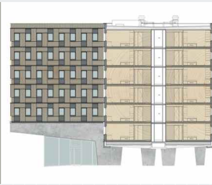
Module im Schnitt