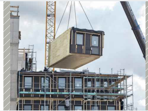
Aufbau vorgefertigter Vollholzmodule

» Schubkräfte werden über die Sylodyn®-Lager abgetragen. Damit kann auf aufwändige Schubknaggen verzichtet werden.