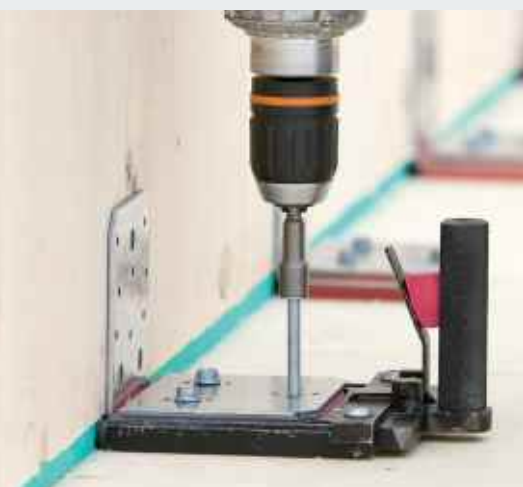
Elastischer Winkelverbinder ABAI 105

B este Wohnqualität setzt einen wirkungsvollen Schutz vor Luft- und Trittschall voraus. Neben dem Schallschutz gegen Lärm von außen ist dieser auch ein Thema im Gebäudeinneren. Um die Schallübertragung auf ein Minimum zu reduzieren, kontaktierte das Bauunternehmen Getzner als Spezialisten für Schwingungsschutz. Das Ergebnis: eine herausragende Lösung zur Schalldämmung.