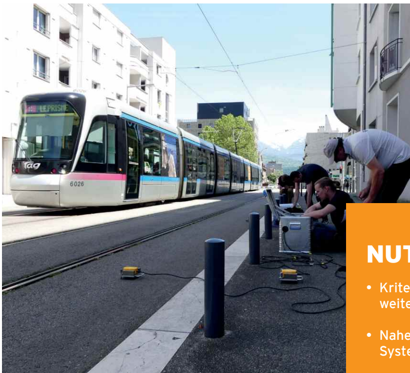
Die Körperschalldämmung wurde durch 16 Messungen mit Vibrationsensoren auf der Sylomer®-gelagerten Fahrbahn und dem isolierten Gehsteig ermittelt.

Marc Beaumont Eisenbahningenieur | Technischer Experte Ingérop