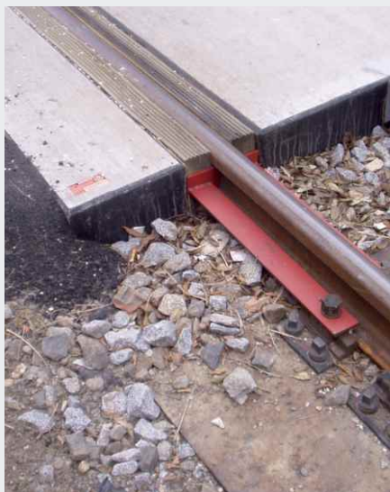
Einbau bei Gleistragplatten

Bei Sylomer® Spurrillenfüller handelt es sich um ein geschlossenzelliges Polyurethan-Elastomer. Dieses Produkt zeichnet sich durch eine hohe Stabilität und Verschleißfestigkeit aus. Bei diesem Werkstoff (PUR) kann es material- und witterungsbedingt zu Schrumpfungen oder zum Wachsen von in etwa 1-2 cm kommen. Dieser Effekt hat jedoch keinerlei Einfluss auf die Funktionalität der Profile.