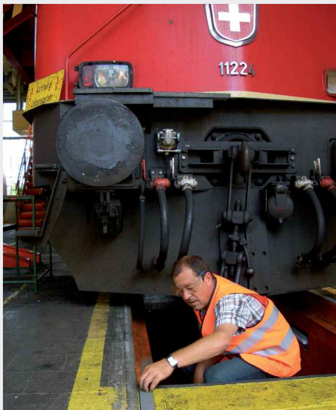
Spurrillenfüller in der SBB Werkstätte

W o Individualverkehr und Bahn-gleise aufeinandertreffen, muss die Sicherheit an oberster Stelle stehen. Die Spurrille zwischen Schiene und Beischiene bzw. zwischen Schiene und Fahrbahnplatte bei Bahnübergängen und Gleisanlagen ist eine gefährliche Stelle für Fußgänger und einspurige Fahrzeuge.