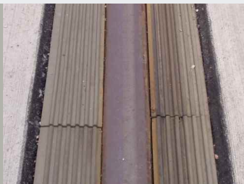
Außenrillen- und Spurrillenfüller