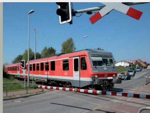
Bahnübergang mit Sylomer® Spurrillenfüller